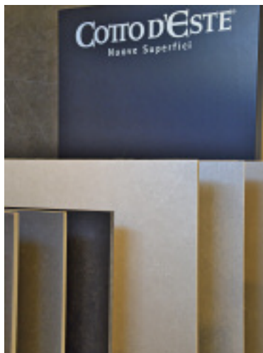
Neu im Sortiment sind großformatige italienische Fliesen für Wand- und Bodenbeläge.

Mit dem Neubau stellt sich Heckeroth & Sahin den aktuellen Herausforderungen. Kunden, die ein Produkt aus Naturstein oder Fliesen haben möchten, sind heute nicht mehr damit zufrieden, in ein Steinlager geführt zu werden. Sie möchten die Muster in ästhetischer Umgebung begutachten und die Glattheit des Steins fühlen können, ohne staubige Finger zu bekommen. Wichtig ist weiter eine fundierte Beratung – ebenfalls in ansprechender Umgebung. Welche Steine und welche Fliesen sind für welchen speziellen Zweck in welcher Bearbeitung am besten geeignet? Auf ehrliche Beratung legt Harry Heckeroth großen Wert: »Wir raten durchaus auch